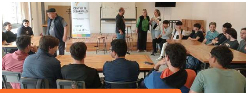
Comienzo de talleres proyecro RIDE