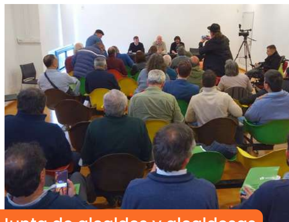
Junta de alcaldes y alcaldesas