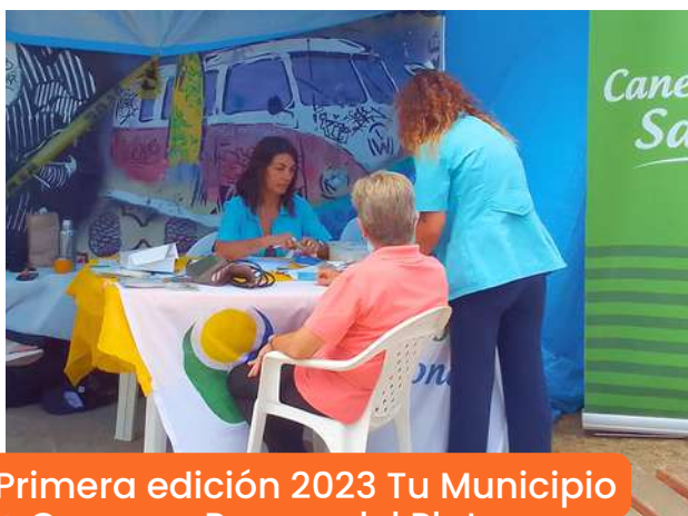
Primera edición 2023 Tu Municipio + Cerca en Parque del Plata

Un resumen de las actividades de nuestra Secretaría