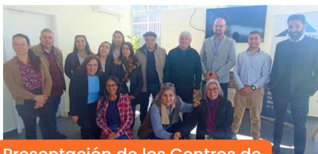
Presentación de los Centros de Desarrollo, Educación y Trabajo