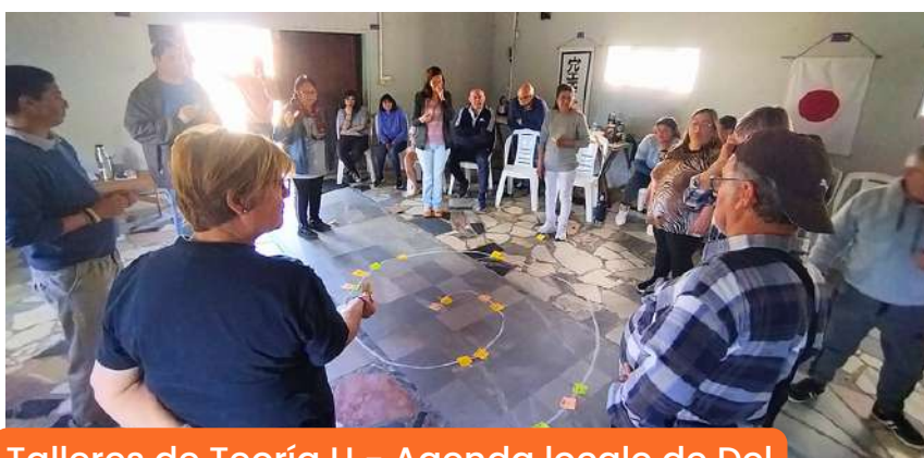
Talleres de Teoría U - Agenda local de Del Andalúz