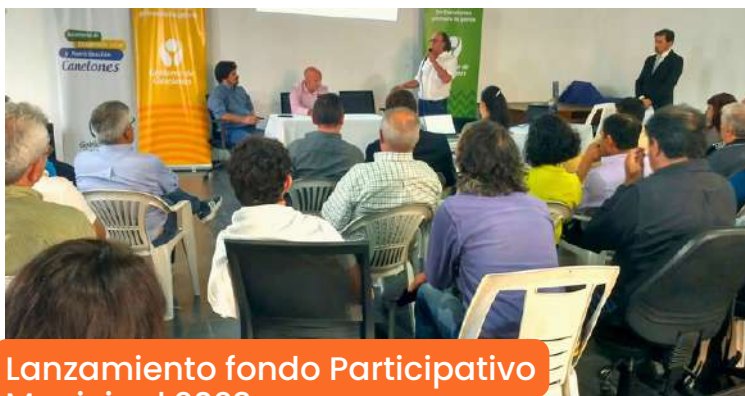
Lanzamiento fondo Participativo Municipal 2023