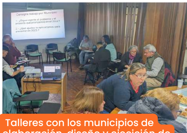
Talleres con los municipios de elaboración, diseño y ejecución de proyectos