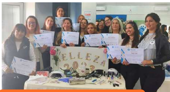
Cierre de talleres de inclusión económica en Villa San José. Fondo Participativo 2022