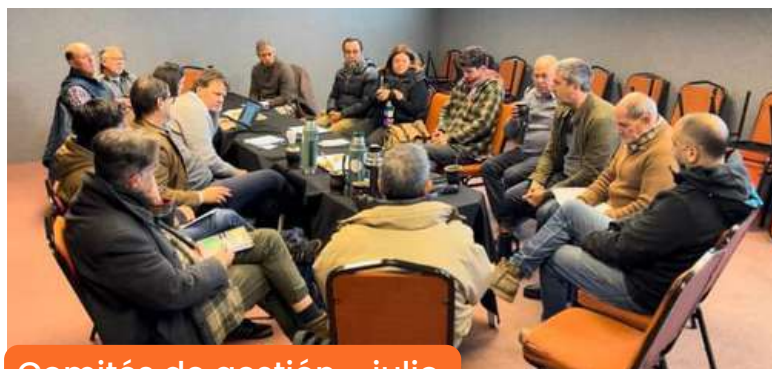
Comités de gestión - julio