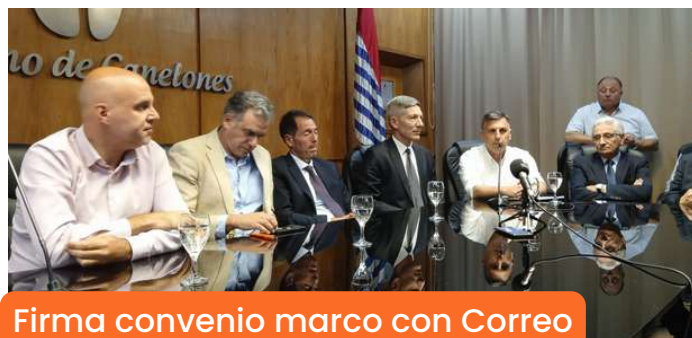
Firma convenio marco con Correo Uruguayo