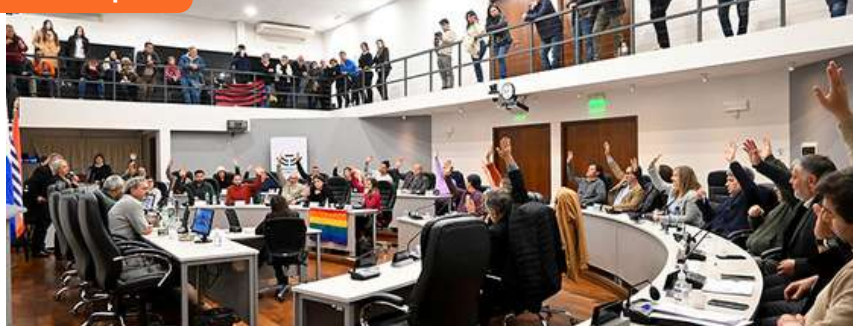
Aprobación en la Junta Departamental del Decreto de creación de los municipios de Juanicó y Del Andalúz y del decreto de regulación de los municipios