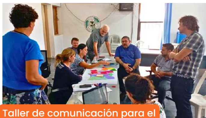
Taller de comunicación para el equipo de la Secretaría