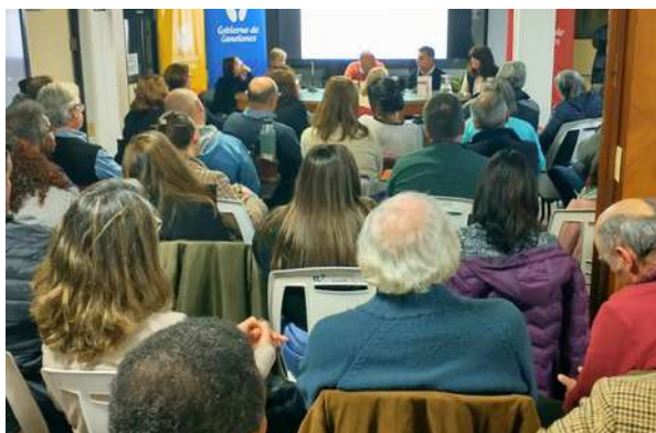
Lanzamiento Agendas locales Municipales