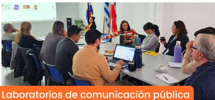
Laboratorios de comunicación pública para funcionarios de los municipios