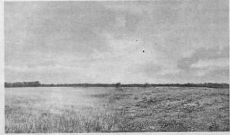
En la instancia estará presente la División de Cambio Climático del MVOTMA, en el marco de un proyecto que tiene a Canelones como una ciudad seleccionada en un plan piloto sobre cambio climático.