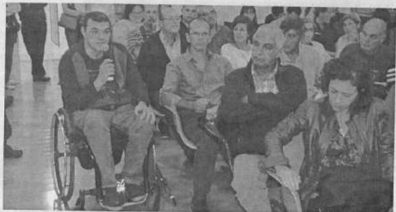
Vecino de la ciudad de Canelones realiza un planteo durante el taller de intercambio por el Plan Local de Ordenamiento Territorial para Canelones capital.

ción en la toma de decisiones y relevamiento de las distintas etapas. La Sala Beto Satragni quedó repleta durante la jornada y por eso no se pudo seguir la planificación, que era la de realizar grupos de discusión luego de la exposición de las arquitectas, pero igualmente se abrió la palabra para todo aquel que quisiera aportar. Rápidamente tomaron la posta los vecinos, que plantearon inquietudes, algunas más puntuales que otras, dando lugar a una instancia muy interesante de diálogo abierto. Entre las inquietudes que plantearon los vecinos estuvo en común el tema de