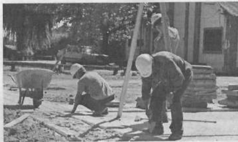
Propuestas sobre transporte, reordenamiento del suelo y espacios públicos para la capital departamental se pondrán sobre la mesa esta tarde en el encuentro en el Complejo Cultural Politeama.