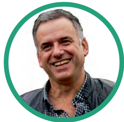
Yamandú Orsi Intendente de Canelones

En este período y dadas las condiciones y maduración del proceso de la política de deportes a nivel departamental, se apostó por jerarquizar a esta área transformándola en una Dirección General, con su presupuesto propio e integrante del Gabinete Social de forma tal que de mantener su esencia de articulación como política social con el resto de las áreas. Esta apuesta significó otro punto de inflexión en la trayectoria de la política de deportes en Canelones que refuerza el compromiso de nuestro Gobierno con el desarrollo humano desde una perspectiva integral. Queda mucho por hacer y el desafío es continuar ampliando este modelo de gestión para multiplicar la cantidad de vecinos y vecinas que cotidianamente tienen acceso a espacios y propuestas deportivas y actividades físicas libremente. Pero la base está creada y es menester reconocer los avances alcanzados hasta entonces poniendo en valor los logros departamentales que hoy son parte del acervo de nuestra comunidad con relación al deporte y la actividad física, claves para un buen vivir.